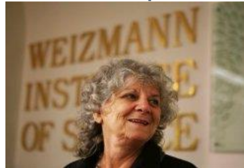
נועה ברגמן עדכון אחרון: 01/02/2010 , 17:42

בכנסת ערכו ישיבה מיוחדת לכבודה של כלת פרס נובל בכימיה עדה יונת, והיא ניצלה את המעמד כדי להביע דעה מעוררת מחלוקת. "עומדים על הפרק ניסויים בבעלי חיים, וצריך לשקול את הנחיצות שלהם גם מבחינה מדעית", אמר פרופסור יונת לחברי הכנסת. היא הוסיפה כי הזכייה שלה גרמה לבנות להבין שגם נשים יכולות לעסוק במדע